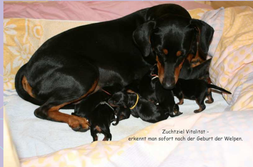
Zuchtziel Vitalität - erkennt man sofort nach der Geburt der Welpen.