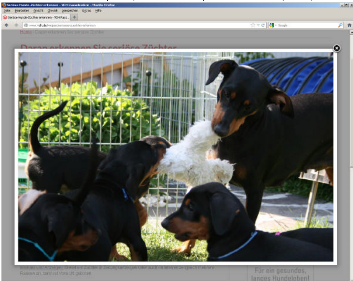
Haller Deutsche Pinscher Welpen – Ophelia und ihre Rosenkinder (B-Wurf)

http://www.haller-deutsche-pinscher.de - Info@haller-deutsche-pinscher.de